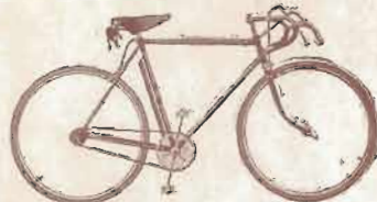
COURSE A BOYAUX

TYPE SC. — Course Standard. — Cadre 54, 57 ou 60 c/m. — Fourche à tête ajourée. — Jantes chromées. — Pneus para. — Rayons fins. — Roue libre double denture et pignon fixe. — Garde-boue 1/2 chromés. — Guidon course ou trial. — Poignées pur para. — Freins « Bowden » course AV et AR avec guide-câbles. — Pédalier course. — Selle grand modèle. — Pompe de cadre. — Sacoche garnie. — Email beige ou mastic.