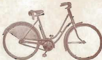
DAME ROUTE FREINS RIGIDES

TYPE PDAN. — Dame route freins rigides. — Mêmes descriptions que le modèle PDN, mais freins à tringles et guidon genre anglais.