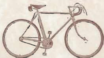
COURSE A BOYAUX

TYPE PCC. — Course chromé. — Mêmes caractéristiques que le modèle PCN, mais toutes pièces polies chromées.