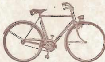
ROUTE FREINS RIGIDES

TYPE LB. — Homme demi-ballon. — Mêmes spécifications que le modèle LR mais pneus demi-ballon.