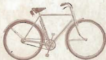
HOMME ROUTE FREINS RIGIDES

TYPE PRAN. — Homme route freins rigides. — Cadre 54, 57 ou 60 c/m. — Jantes nickelées. — Freins à tringles et Guidon genre anglais. — Pompe et sacoche garnie. — Email noir ou gris Dandy avec filets et décors assortis.