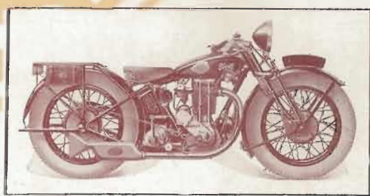
500 cc. - 5 cv. - 4 temps TYPE NTO-NSO TOURISME ou SPORT LÉGÈRE — Prix : 5.750 frs TYPE NSSO 1 SUPERSPORT, 1 échappement — Prix : 6.800 frs TYPE NSSO 2 SUPERSPORT 2 échappements — Prix : 7.100 frs

Établ. TERROT 2, Rue André-Colomban DIJON