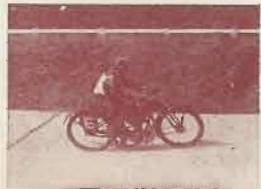
PERROTIN en vitesse sur la piste de Montlery