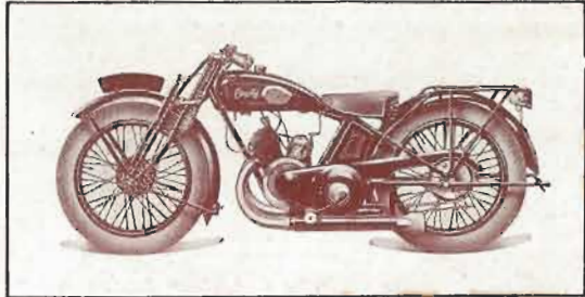
175 cc. - 2 cv. - 2 Temps TYPE LPP STANDARD — Prix : 2.350 frs TYPE LC2 TOURISME — Prix : 2.850 frs TYPE LSO SPORT — Prix : 2.950 frs