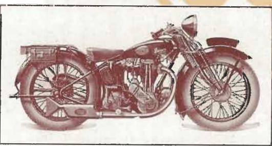
350 cc. - 4 cv. - 4 Temps TYPE HST STANDARD : 4.375 frs. - TYPE HSSO SUPERSPORT, 1 éch te : 5.500 frs TYPE HOT TOURISME : 4.950 frs. - TYPE HSSR SUPERSPORT, 2 éch tes : 5.950 frs TYPE HOS SPORT LUXE : 4.950 frs. - TYPE HSSE culbuteurs enfermés : 6.200 frs