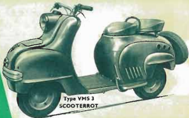
Type VMS 3 SCOOTERROT

TYPE VMS 3 : Spécifications. — Moteur 125 cc. 2 t. 4 cyl. 40 mm, 4000 tr/mn, 2 cyl. 40 mm, 4000 tr/mn, 4 cyl. 40 mm, 4000 tr/mn. — Alimentage et del. par val. magn. Ref. par turb. à air car. et circ. facile. Baie 2 val. car. par. rap. de dém. à 1 er : 3,43 à 1. 2 e : 4,83 à 1. Omb. à disp. mult. Freins à tamb. AV. d. 150, AR. d. 130. Pneu de 8 x 3,5. Chang. rap. de la ch. à air par moy. amov. Susp. AV. tube art. sur bras. à air. amov. Susp. AR. tube art. sur bras. de ch. et sup. par bloc amov. moy. Divers : Réa. vit. 71. Coff. à tout usage pour le régl. pneu. un socle fix. de mont. Pneu. lat. AR amov. Pas roug. cassé. Avert. élect. Vit. 75 km/h. Cons. : 2,5 l. aux 100 km.