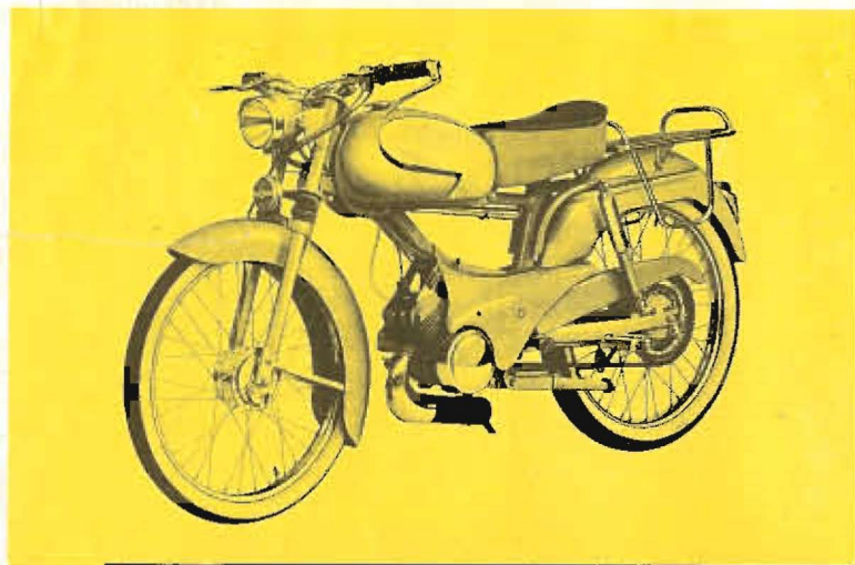
VL 3 T monoplace