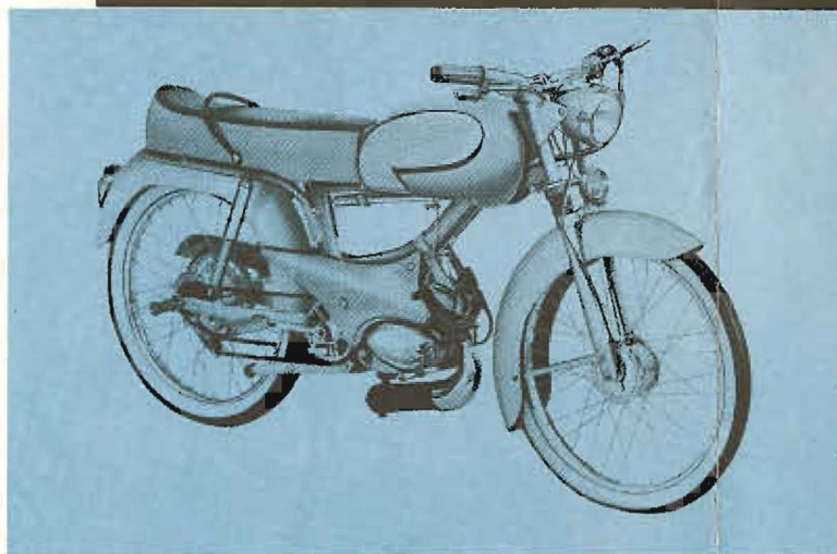
VL 3 T biplace