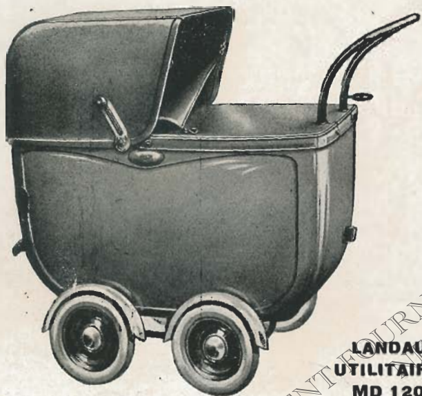
LANDAU UTILITAIRE MD 120

TYPE MD85. STANDARD. — Caisse classique à panneaux emboutis. Dimensions int.: long. 820, larg. 420, prof. 480. Garnit. intér. molesk. Suspension extra-douce à ressorts int. Capote à compas invisibles brevetée. Doubl. satin blanc. Tablier doublé satin. Roues tôle à roul. lisses avec enjoliveurs. Band. 190×27. Guidon et toutes pièces nick. Email bleu ou gris, intér. blanc. TYPE MD120. AMELIORE. — Comme MD85 mais avec ceinture de sûreté. Pare-chocs. Porte-parapluie. Garde-boue alum. poli. Pièces nickelées.