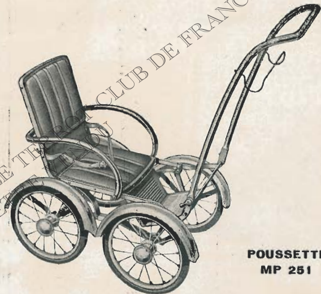
POUSSETTE MP 251

TYPE MP248. AERO-POUSSETTE STANDARD. — Montage entièrement métal. Suspension souple par ressorts à lames. Dossier et marche-pied à deux positions. Garnit. molesk. Roues tôle. Roul. lisses. Band. 190x27. Ceint. de sûreté. Pièces nick.