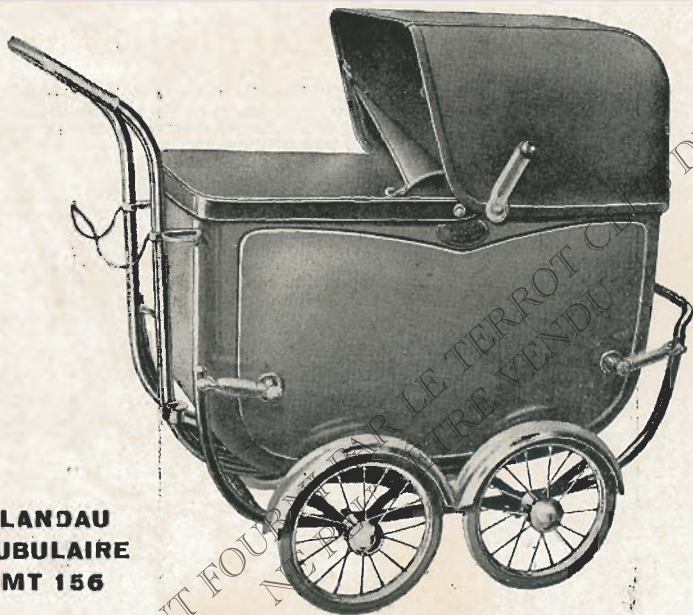
LANDAU TUBULAIRE MT 156

MD123 mais avec roues ou gris, intérieur blanc. Comme MD124 mais avec d. 300×30.