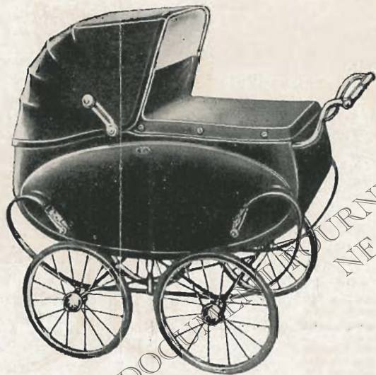
LANDAU ANGLAIS MD 143

TYPE MD143. — Comme MD142, mais avec roues à rayons de 350.