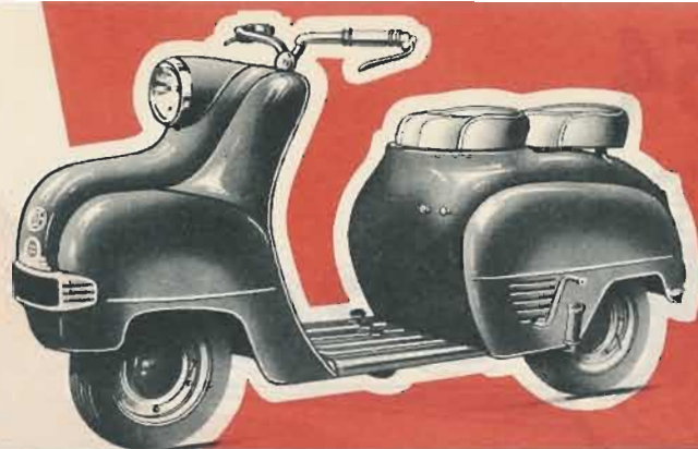
SCOOTER 125 cm 3 type S 25

SPÉCIFICATIONS : Moteur 125 cm 3 , 2 temps à piston étoilé, distribution à 2 transferts, culasse hémisphérique, en alliage léger, alésage 53,5, course 55. — Allumage et éclairage par volant magnétique. — Refroidissement par turbine à air canalisé et circulation forcée. — Carburateur : starter automatique, commande des gaz par poignée tournante. — Boîte : 2 vitesses, commandées par deux pédales, rapports de démultiplication : 1 re : 9,45 à 1, 2 me : 4,83 à 1. — Débrayage à disques multiples. — Freins : à tambour ; AV, diam. 100, commande au guidon, AR, diam. 130 à commande au pied. — Roues : sur roulements annulaires indéformables. — Pneus de 8 x 3,5. Changement rapide de la chambre à air par flasque amovible. — Suspension : AV, tube articulé sur biellettes et anneaux caoutchouc. — Siège AR, tube pivotant sur articulation du châssis et suspension par bloc caoutchouc comprimé, siège galbé Dunlopillo. — Divers : Réservoir essence 7 litres. — Coffre à outils amovible, sous le siège, permettant un accès facile du moteur. — Pare-chocs AR et AV. Panneaux latéraux arrière amovibles. — Feu rouge catadioptrique. — Avertisseur électrique. — Vitesse : 70 kms h. — Consommation : 2 l. 5 aux 100 kms.