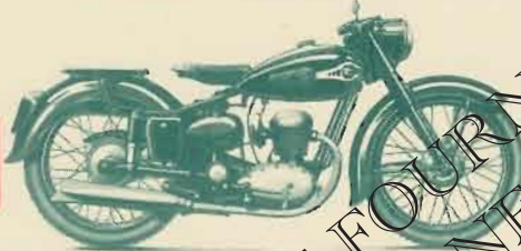
Type M 4 SD

Moteur licence n° VILLIERS n° 98 cm 3 , 2 t., mise en route par lanceur, allum. et écl. par vol. magn., 2 vit. avec com. au guidon conjug. avec le débr., cadre monot. fourche télesc. pneus 600 x 65, fr. tamb. AR, AV d. 115, grand carter de protection, phare avec ind. de vit. incorporé, réserv. 6 l. Email blanc pte., poids 52 kg, Vit. 65 km/h. env. Sabots protect. avec suppl.