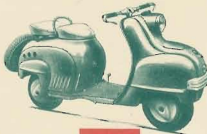
Type S 3

FAUVETTE 2 Type Grand Luxe Bloc-moteur 2 t., 48 cm 3 , 2 vit., fourche télesc., cadre conf. ent. par chaîne. Poids env. 40 kg, vit. 40 km/h, cons. 1,8 l. aux 100 kms.