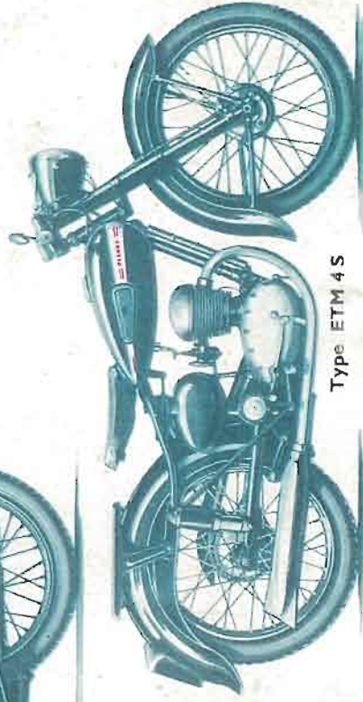
Type ETM 4 S

125 cm 3 Type ETM Bloc moteur 4 temps. - Monotube soupapes en tête, totalement encloses et grais- sées par circulation d'huile, commande par culbuteurs. - Culasse alliage léger. - Cylind- rée 123 cm 3 (52x58). - Graissage à circulation con- tinue et carter sec par pompe double à engrenages. - Allumage par volant magné- tique à avance variable. - Car- burateur automatique avec volet de départ et filtre à silencieux tubulaire. - Transmis- sion primaire par engre- nages et secondaire par chaîne. - Boîte de vitesses séparée, 4 vitesses, sélecteur au pied, volet de départ à 1. - Débrayage très souple à disques multiples à AV, 130 à AR. - Moyeu AR aluminium à broche faisant amortisseur de transmission. - Pneus AV 600x65, AR 25x3. - Fourche téléscopique à grand débatte- ment. - Cadre tubulaire enlame- ment brasé. - Guidon orientable avec poignée tournante gas. - Selle caoutchouc suspendue, ressort horizontal réglable. - Porte-bagages amovible. - Carter enjoliveur cache-volet. - Béquille cen- trale. - Plaque de police AR lumineuse. - Réservoir d'essence 10 litres. - Genouillères. - Réservoir d'huile 3 litres. - Sacoches. - Éclairage par tête avec outillage. - Pompe cadre. - Éclairage par volant magnétique. - Avertisseur électrique. - Indicateur de vitesse incorporé dans le platier. - Poids : 78 Kilogs.