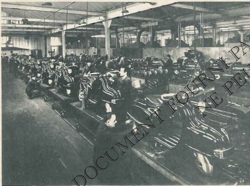
UNE CHAÎNE DE MONTAGE