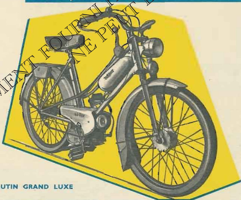
LUTIN GRAND LUXE

Moyeu monobloc, tubes de fourche chromés, commuta- teur code-phare, phare avec comp- teur incorporé, aver- tisseur électrique.