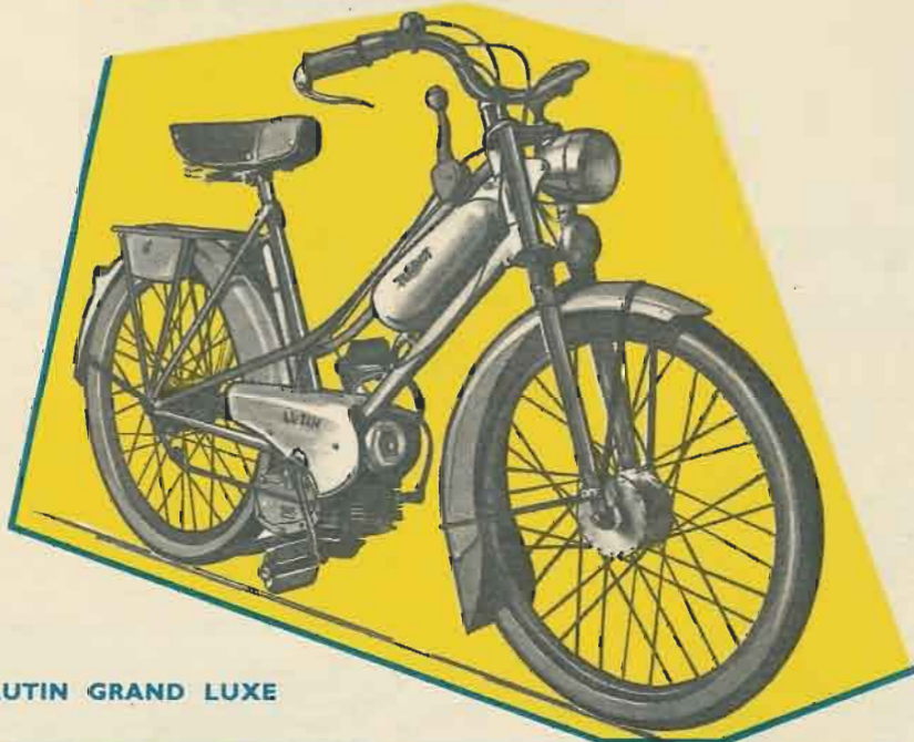
LUTIN GRAND LUXE

Moyeu monobloc, tubes de fourche chromés, commuta- teur code-phare, phare avec comp- teur incorporé, aver- tisseur électrique.