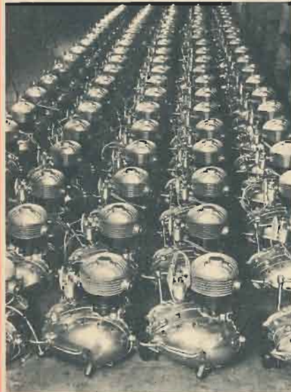
SORTIE DE LA CHAÎNE DE MONTAGE DES MOTEURS