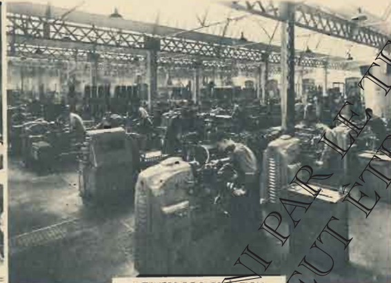
ATELIERS DE FABRICATION