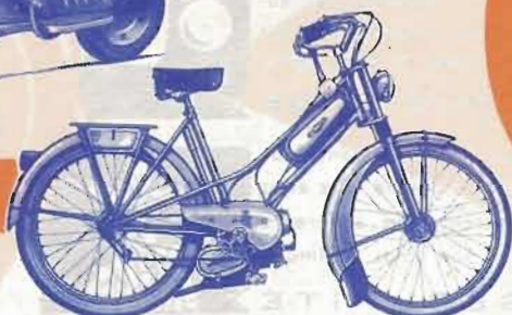
LUTIN LUXE 50 cm 3

SCOOTERROT : Moteur 125 cm 3 2 t. à pist. étoilé, dist. à deux transf., culasse en alliage léger; (53,5-55), allum. et écl. par vol. magn., refr. par turb. à air can., boîte 3 vit. en commande, présél., rap. de dém. : 1 re : 2,8 à 1, 2 e : 7,27 à 1, 3 e : 4,83 à 1, freins : à tamb. : AV. et AR, d. 130, pneus 8 x 3,5, roue de secours, rés. d'ess. 9 l. environ, carr. AR amov. bascul. avert. élect., vit. : 75 km/h., consom. 2,8 l. aux 100 kms.