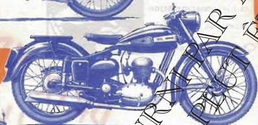
125 cm 3 Type ETDS

Type ETDS : Bloc mot. 4 t., soup. en tête, com. par culb., graiss. à circ. cont. et carter sec par pompe à double engren., allum. dynamo-batt., avance autom., freins tamb. 130 mm double enjoliv. de moyeux polis, moyeux AR à broche, fourche télesc. à amortiss. hydraul. à double effet, suspens. AR oscill. à amortiss. hydraul., selle caout. susp., porte-bagages, cache-bat., garde-boue profonds très envelop., réserv. ess. 10 lit., réserv. huile 3 lit., écl. par dyn. en bout d'arbre et batt., avertiss. élect., indic. de vit. incorp. dans le phare. Poids : 97 kgs.