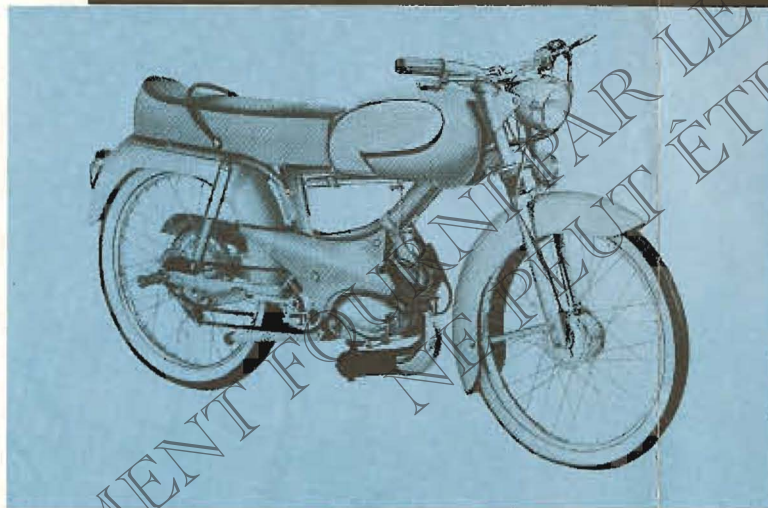
VL 3 T biplace