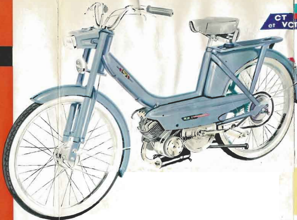
CT et VCT C