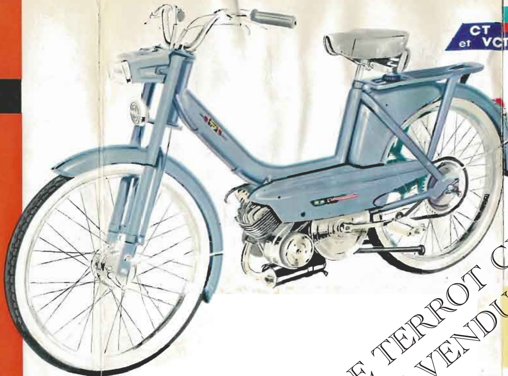
CT et VCT C