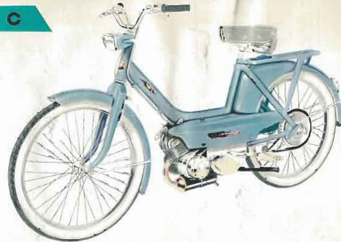
C - Modèle d'usage courant. Deux freins puissants dont un à tambour. CT - Modèle confort. Suspension AV. Deux freins à tambour. VCT - Même modèle que CT, avec changement de vitesse automatique.

Tous nos modèles sont équipés d'un double embrayage automatique. Vous freinez : vous vous arrêtez — vous accélérez : vous repartez. Vitesse limitée à 50 km/h. — Utilisation à partir de 14 ans et sans permis de conduire.