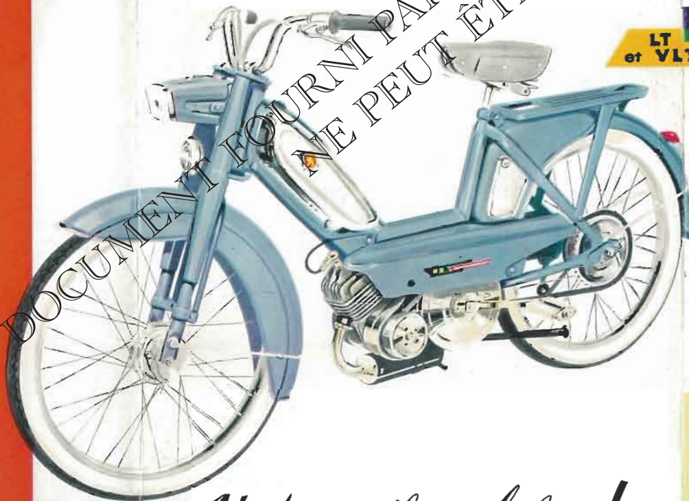
LT et VLT V et TLS