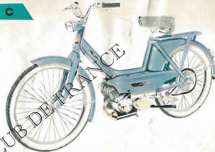
C - Modèle d'usage courant. Deux freins puissants dont un à tambour. CT - Modèle confort. Suspension AV. Deux freins à tambour. VCT - Même modèle que CT, avec changement de vitesse automatique.