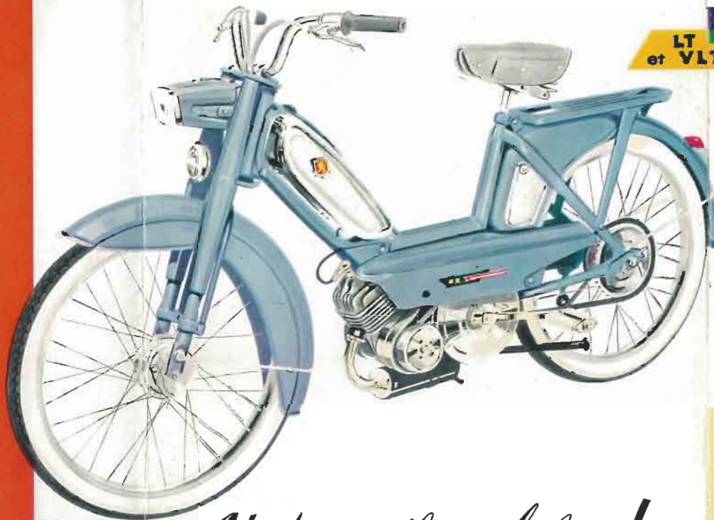
LT et VLT V et TLS

Tous nos modèles sont équipés d'un double embrayage automatique. Vous freinez : vous vous arrêtez — vous accélérez : vous repartez. Vitesse limitée à 50 km/h. — Utilisation à partir de 14 ans et sans permis de conduire.