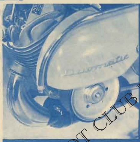
Embrayage 100% automatique Duomatic de conception nouvelle (brevet TERROT) assurant un entraînement doux et progressif.