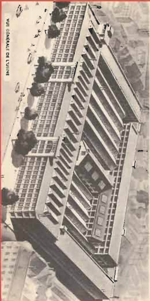
VUE GÉNÉRALE DE L'USINE

Dans la catégorie militaire, TERROT enlève les premières places des classements individuels et par équipes.