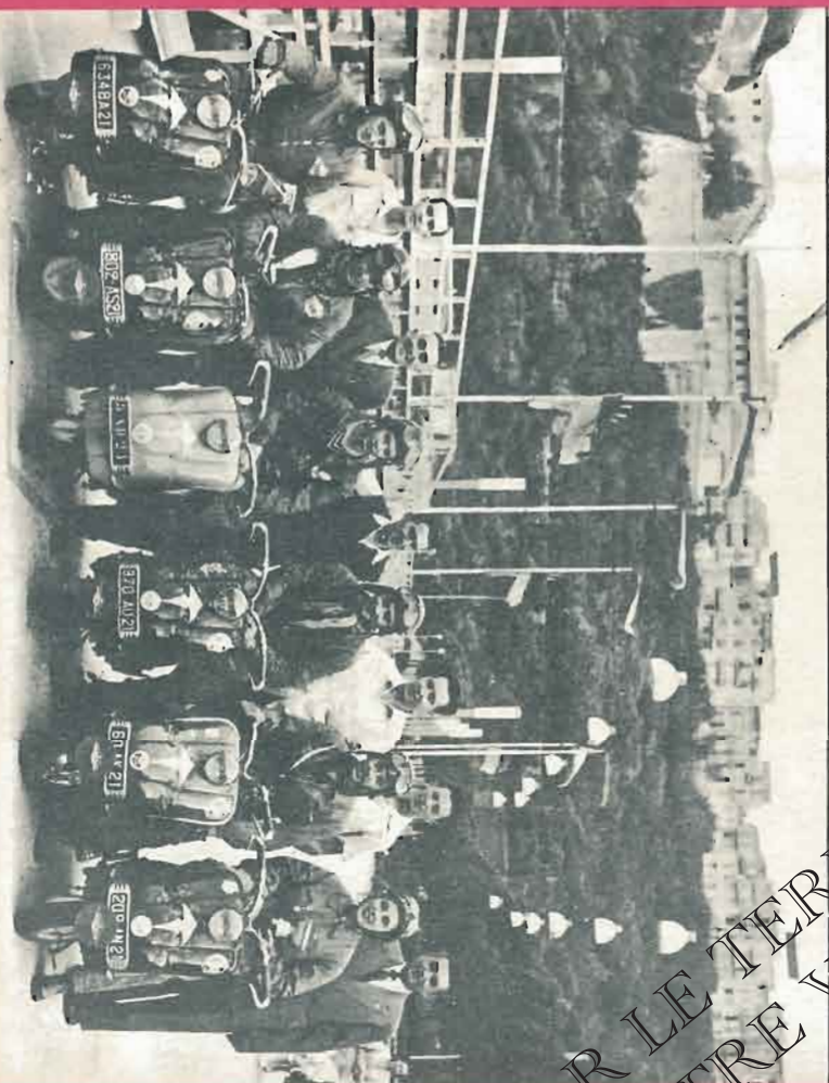
CONCENTRATION INTERNATIONALE DE SCOOTERS A MONACO 6 scooters au départ, 6 à l'arrivée, enlevant la Coupe Internationale et la Coupe Nationale pour le plus grand kilométrage.