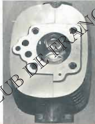
La chambre de combustion est rigoureusement hémisphérique. Soupapes légères en tulipe. Larges ailettes de refroidissement.

Moteur 4 temps 175 cc. à soupapes en tête, commandées par cames silencieuses et tringles en alliage léger.