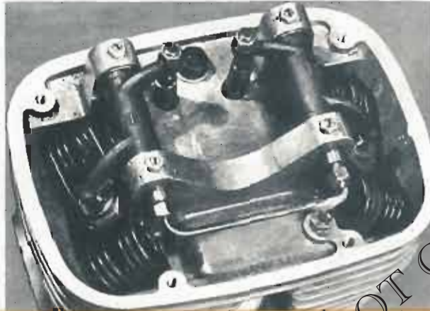
La culasse en alliage léger est recouverte d'un boîtier étanche (démonté sur la photo). Note: le graissage sous pression des culbuteurs et les doubles ressorts de soupapes en épingle à tension équilibrée (Brevet Ferrari).