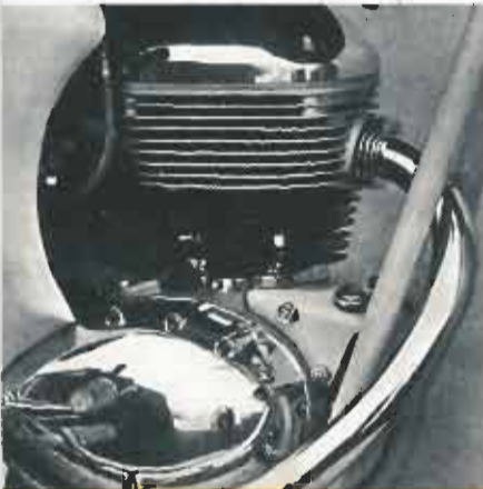
Le bloc moteur est suspendu sur des amortisseurs en caoutchouc anti-vibratoires. Puissance : 10 CV, à 6.300 tours.